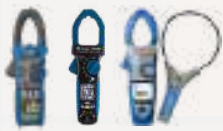
PINZA AMPERIMÉTRICA + I-FLEX